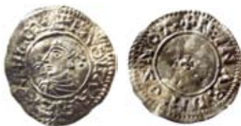
Fig. 5. England. Edgar 959-975. Reform Small Cross typ ca 973-975, Nottingham, myntmästare. Reinard. Nottingham var tidiagre okänd som myntort för denna typ och Reinhard, som namnet kan normaliseras, är mycket ovanligt under denna tid.

Denna rekonstruktion förklarar varför de arabiska mynten är överrepresenterade jämfört med vad som fanns i omlopp i början av 1000-talet. De bysantinska mynten har också en märklig fördelning med två ex. från Johannes I Tsimiskes I 969-977 och ett från Basileios II 976-1025. Normalt skulle det finnas fyra gånger fler mynt från Basileios jämfört med Johannes I Tzimiskes. Myntningen i Tyskland skedde i regi av ett mycket stort antal myntherrar vid sidan av kungen/kejsaren såsom ärkebiskopar, biskopar, hertigar,