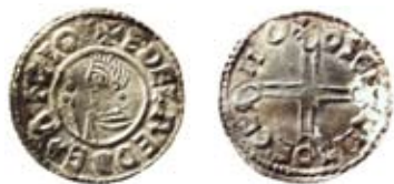
Fig. 6. Tidigare okänd skandinavisk efterprägling som visar en hybrid av Æthelred II:s Crux och Long Cross typer. Frånsidans inskrifter kopierar myntortens York och myntmästarnamnet Asketil (Oscetl).

Helmet 1003-1009 34 Last Small Cross 1009-1017 67