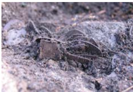
Fig. 3. I de översta skiktet kunde man fortfarande se att mynten en gång legat samlade, möjligen i staplar.

Därifrån vidtog en rad telefonsamtal, chefer och länsstyrelse informerades, en arkeolog med särskild vana att arbeta med metalldetektor kallades ut. Eftermiddagen blev intensiv, med flera besökare, kontinuerligt grävande, dokumenterande och avsökande med detektor för att få upp alla mynt innan kvällen kom. Mynten vilade på ett större stenblock och låg väl samlade inom ett ca 10x30 cm stort område med inblandning av humus och rottrådar. De stora stenblocken och den lösa myllan innebar att mynten låg tämligen löst och inte kunde plockas upp som ett preparat. Några enstaka mynt hade letat sig ner mellan springor i stenpackningen och påträffades först efter att de stora stenblocken lyfts bort med hjälp av grävmaskinens gripklo. Mynten gav intryck av att ha legat i något form av hölje, en tygpåse eller möjligen en träask