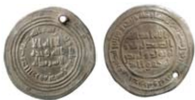
Fig. 7. Umayyad. Kalif xxxxxxx. Dimashq 83 e.H./702/3 e.Kr. Dirhem.