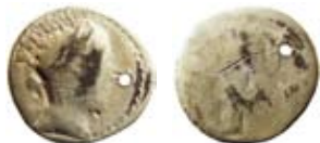
Fig. 4. Barbarisk efterprägling av en romersk denar. Som vanligt i gotländska fynd är den mycket sliten och den är dessutom försedd med ett hål, vilket visar att den vid någon tidpunkt burits som ett smycke. burits

Skatten har preliminärt slutmynt 1018, men det kan ändras vid en noggrann genomgång. Relationerna mellan de olika präglingsområdena påverkas av att en analys av den kronologiska fördelningen visar att det är fråga om en familjeskatt som byggts upp under två generationer. Familjesskatter är ett vanligt fenomen på Gotland (Persson 1992, 34). I detta fall har en äldre generation fram till 980-talet förvärvat nästan alla arabiska mynt, alla tre bysantinska mynt, ett antal tyska och de två äldsta engelska (möjligen några fler). Därefter har en ny generation fortsatt bygga på skatten fr.o.m. ca 1000 och två decennier framöver tills skatten hamnade i jorden i början på 1020-talet. Att nästa generation i sin tur lät den ligga kvar i jorden kan tyda på att man hade byggt upp en egen skatt. Att döma av det lösfunna myntet präglat vid mitten på 1000-talet fanns i alla fall mynt i omlopp på gården under den tiden.