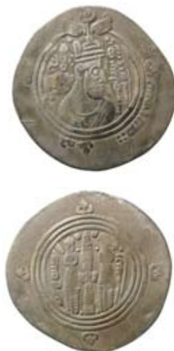
Fig. 5. Arabo-sassanid. Muhallab b. Abi Sufra. BYSh (Bishapur, nuvarande Iran) 76 e.H./695 e.Kr. Drachm.