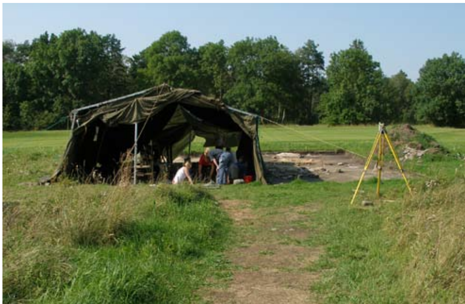
Fig. 1. Fyndplatsen under utgrävning. P.g.a. att den låg mycket nära ett av golfbanans hål var det nödvändigt att ha ett skydd mot golfbollar som hamnade vid sidan av greenen.

I ängs- och åkermarken väster om bebyggelsen finns ett flertal lämningar av järnålderns gårdar. Inte långt från platsen för den påträffade skatten finns ett stenblock