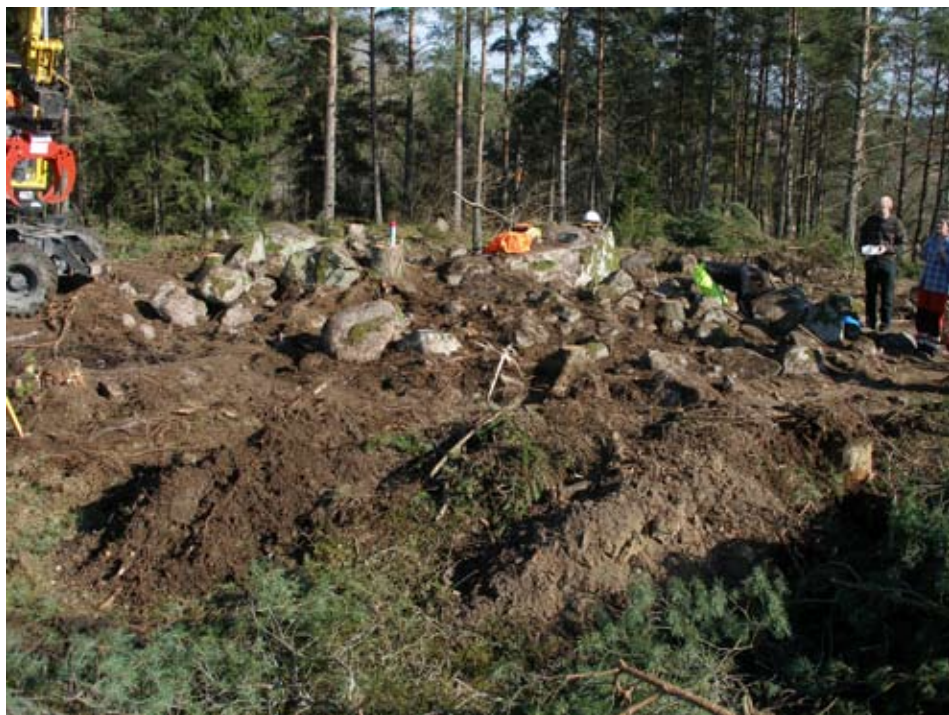
Fig. 1. Fyndplatsen med graven från förromersk järnålder.

I samband med utbyggnaden av en ny trädgårdsstad kallad Steningehöjden, några kilometer öster om Sigtuna fick UV-mitt vid Riksantikvarieämbetet i uppdrag att undersöka en ensamliggande grav i form av en stensättning på krönet av en höjd.