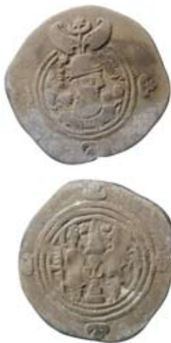
Fig. 4. Sassanidiska riket. Xusro II 590/1-628. Drachm .....

från Sundveda, uppvisar likheter med detta fynd. Denna skatt med ett t.p.q. (terminus post quem - slutmynt) på 832-834 e.Kr, innehöll minst 468 mynt och vägde drygt 900 g. I övrigt finns det mycket få skattfynd från Mälardalen som lagts ner under första hälften av 800-talet och mitten av 800-talet. De få som finns innehåller betydligt färre mynt. Skattfyndet vid Sundveda är därför av stor betydelse för vår förståelse för de tidiga, vikingatida kontakterna i österled.