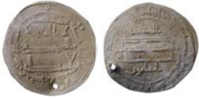
Fig. y. Khazar, efterprägling av Abbasid, "Madinat al-Salam 104", daterbar till ca 223 e.H./837-38 e.Kr. (tpq efter Devitsafyndet i Ryssland; finns även i Vyzhighshafyndet, tpq 227 e.H.).