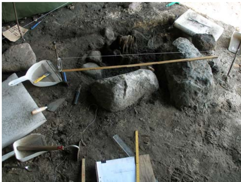
Fig. 3. Det bäst bevarade stolphålet (anl. 7 på planen fig. 2) som har stöttas av två stora och ett flertal mindre stenar. Träet är mycket välbevarat och är inämnat för dendrodatering vilket gör att man kan fastställa exakt år när det fälldes, d.v.s när huset byggdes. Stolpen är bevarade till en längd av ca 40 cm.

kontinuitet under mycket lång tid och de har hamnat i jorden vid fyra olika tillfällen. Det äldsta myntet är en barbarisk efterprägling av en romersk denar. (fig. 4) Efterpräglingarna är relativt sett vanliga i gotländska fynd och det gjorde att man för länge sen trodde att en del av dem kunde vara präglade på Gotland. Lennart Lind kunde senare konstatera att de romerska mynten importerats från norra Polen, sannolikt på 300-talet, och efterpräglingarna hade då följt med till Gotland (Lind 1988, 112-121). En vikingatida skatt har hamnat i jorden ca 1020. Ett tyskt mynt från Jever, präglat vid mitten av 1000-talet, visade sig vara betydligt yngre än skatten och är därför ett lösfynd som har hamnat i jorden någon tid efter mitten på 1000-talet. Dessutom