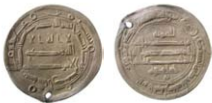
Fig. 7. Abbasid. Kalif al-Mu'tasim. Madinat Arran 220 e.H./835 e.Kr. Dirhem.