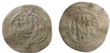
Fig. 6. Arabsasanid, Tabaristan 130 PYE/781 e.Kr. Halvdrachm.