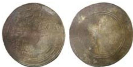
Fig. 7. Abbasid. Kalif al-Mu'tasim. Samarqand 220 e.H./835 e.Kr. Dirhem.